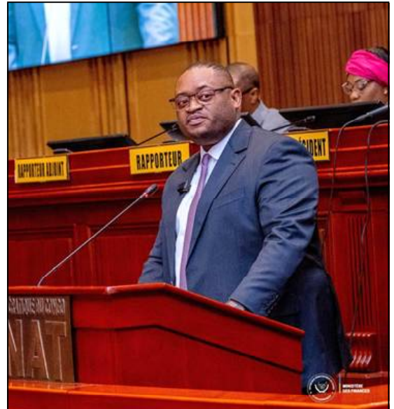
Le Sénateur Célestin Vunabandi.

que 40 % des recettes à caractère national allouées aux provinces soient retenues à la source.