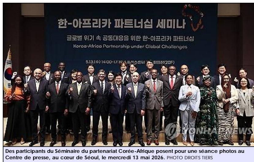
Des participants du Séminaire du partenariat Corée-Afrique posent pour une séance photos au Centre de presse, au cœur de Séoul, le mercredi 13 mai 2026.

Le forum est intervenu à l'approche de la réunion des ministres des Affaires étrangères Corée-Afrique qui aura lieu à Séoul les 1 er et 2 juin, et rassemblera des chefs de diplomatie et