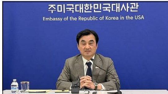
Le ministre de la Défense Ahn Gyu-back donne un point de presse devant des correspondants sud-coréens aux Etats-Unis, le mardi 12 mai 2026 (heure locale), à l'ambassade sud-coréenne à Washington.

Ahn a dit que Hegseth a fait part de sa compréhension durant leur réunion sur les