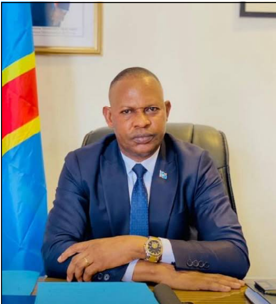
Le ministre de l'Emploi et du Travail, Ferdinand Massamba wa Massamba.

Le lundi 18 mai prochain est déclaré journée «chômée et payée sur toute l'étendue du territoire national», selon un communiqué officiel du ministère de l'Emploi et Travail rendu public hier mercredi 13 mai.