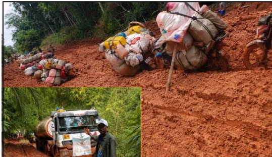
Une vue de la route nationale numéro 4 au point kilométrique 45 de la ville de Kisangani.

D'après Prince Yongo, coordonnateur de la société