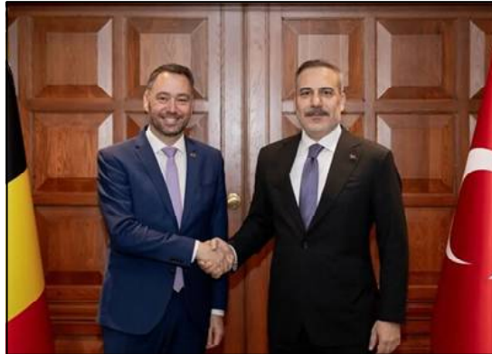
Le ministre turc des Affaires étrangères, Hakan Fidan, a rencontré le vice-Premier ministre et ministre belge des Affaires étrangères, Maxime Prévot.

Les deux ministres de la Défense ont ensuite tenu des discussions à huis clos, à