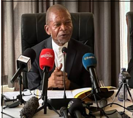
L'archevêque Ejiba Yamapia.

Au cours d'une conférence de presse organisée dans la capitale congolaise, le président de l'Église de réveil du Congo a soutenu qu'une refonte de la loi fondamentale devrait désormais être portée par les citoyens eux-mêmes, dans